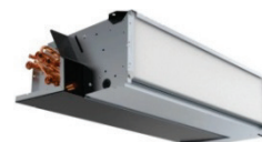
PAW - FC ... - D ... VENTILO-CONVECTEUR Moyenne pression statique