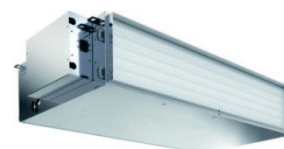
PAW - FC ... - E ... VENTILO-CONVECTEUR Haute pression statique